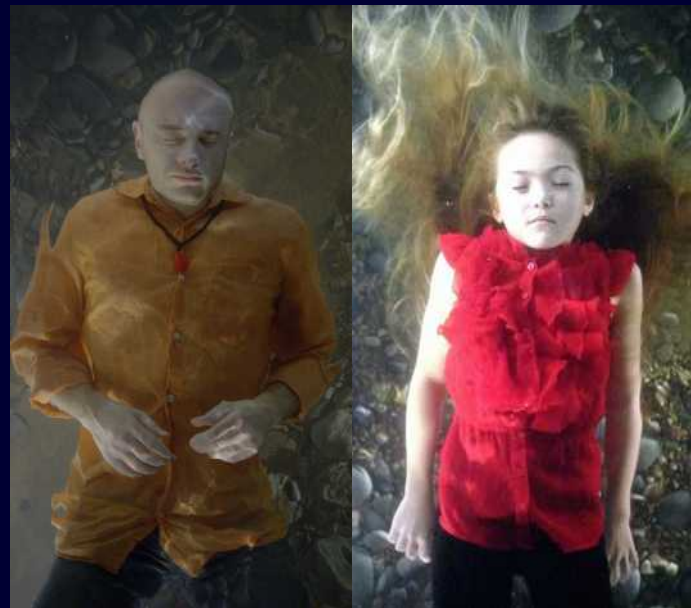
Bill Viola "The Dreamers" (2013) videogrammes de l'installation video