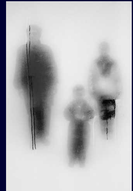
John Batho Série Présents/Absents (1998) photographie